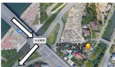
永安橋東の信号を右折する

「永安橋東」交差点を南(河口方向)に入り、吉井川堤防上の道路を約 70m 進む。 → 緑のポールがある下り坂を吉井川河川敷(堤防下)に降り、南へ 250m